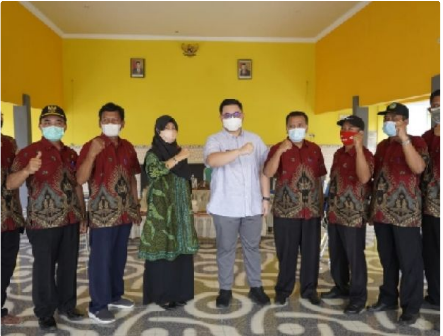
Mas Bup Dhito bersama 8 Kepala Desa se Kecamatan Badas usai melakukan diskusi dan dialog di Balai Desa Lamong

KEDIRI - Setelah melakukan peninjauan vaksinasi di Pasar Kandangan, Bupati Kediri Hanindhito Himawan Pramana yang akrab disapa Mas Bup Dhito berkunjung ke Desa Lamong bertempat di Balai Desa Lamong, Kecamatan