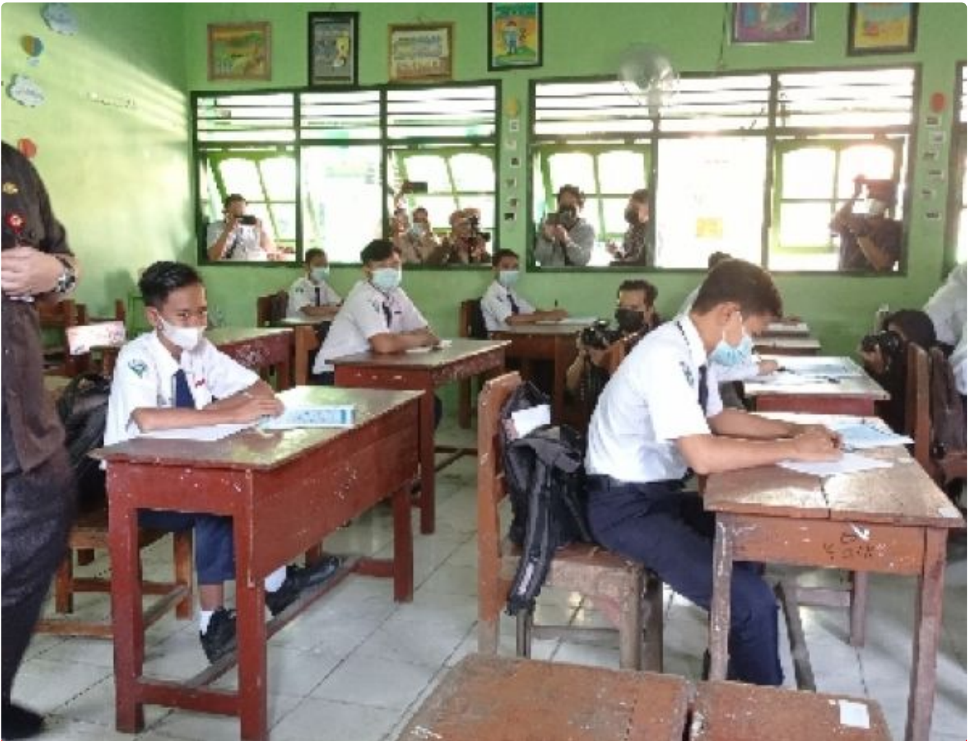
Mas Bup Dhito saat sidak kelas melakukan interaktif dengan salah satu siswa SMPN 1 Ngadiluwih

KEDIRI - Bupati Kediri Hanindhito Himawan Pramana akrab disapa Mas Bup Dhito melakukan sidak pembelajaran tatap muka di SMP Negeri 1 Ngadiluwih Kabupaten Kediri, Jawa Timur didampingi Kepala Dinas Pendidikan Kab Kediri Sujud, Selasa (27/4/2021).